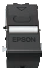
Nettoyeur à tissu