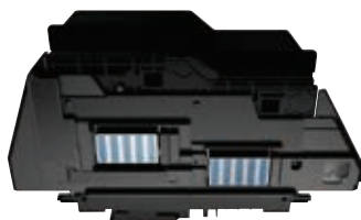
Protection de tête d'impression