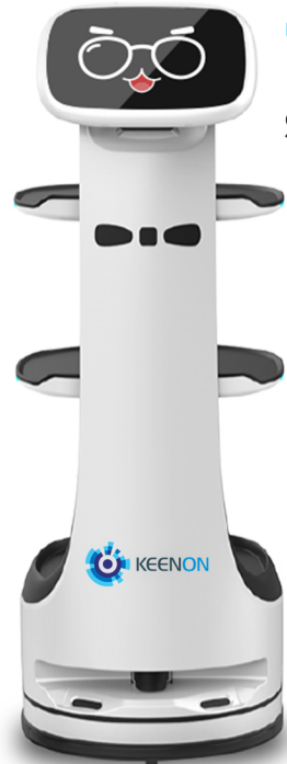
T8 Servis Robotu