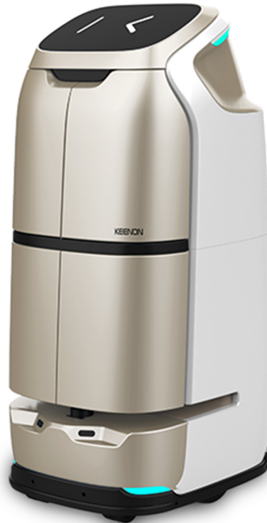
W3 Hizmet Robotu