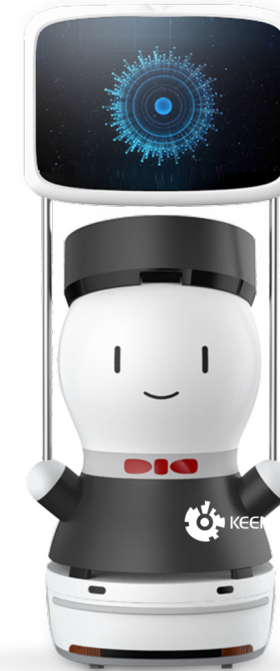
G2 Karşılama Robotu