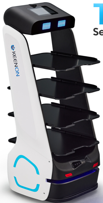
T5 Servis Robotu